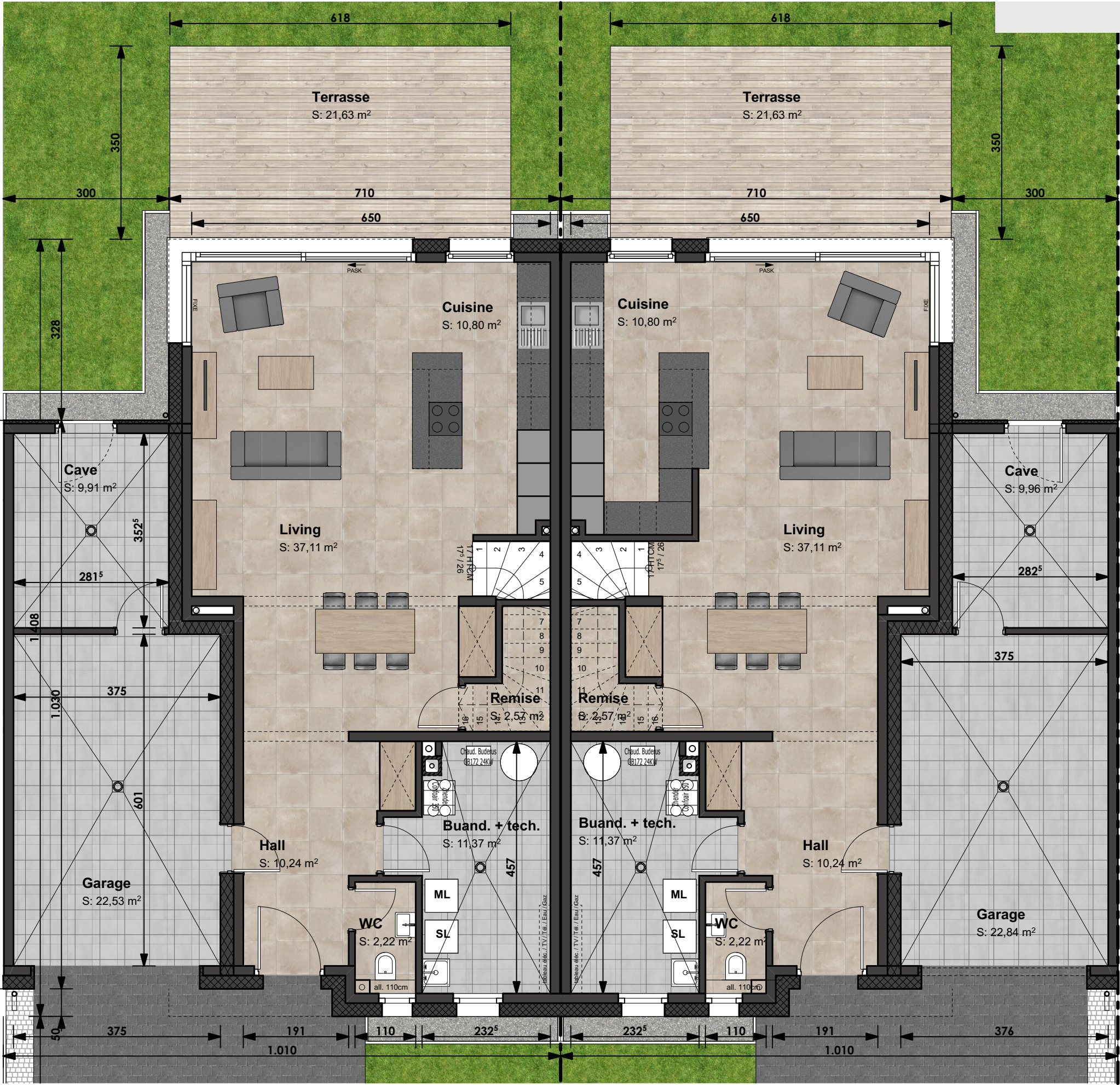
LOT 3 LOT 2